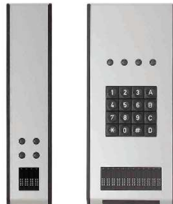
Statusmodul und Telekommunikationsmodul zur Erweiterung der VarioPro