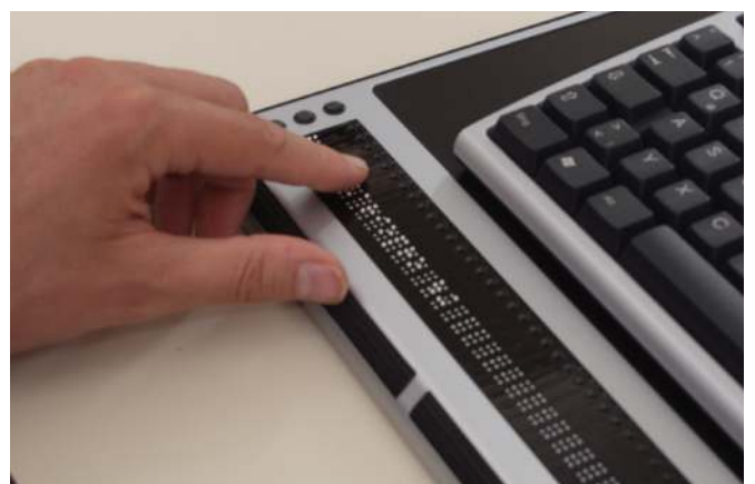
Rutschfeste und großzügige Fläche für Ihre Tastatur