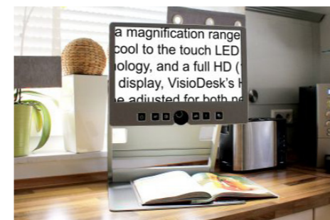
VisioDesk erlaubt den flexiblen Einsatz an unterschiedlichen Orten.